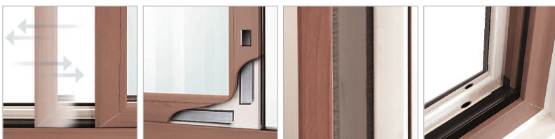
블록레인과 요홈형 대형롤러