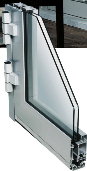
A 70P DR